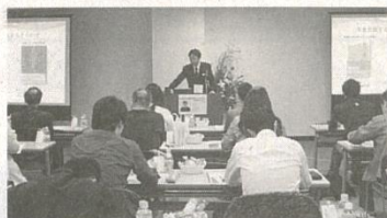
幻冬舎主催 セミナー風景

不動産経営の落とし穴 「負けない投資ならワンルームマンションを選びなさい」の著者も登場!