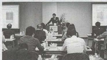
幻冬舎主催 セミナー風景

不動産経営の落とし穴 「負けない投資ならワンルームマンションを選びなさい」の著者も登場!